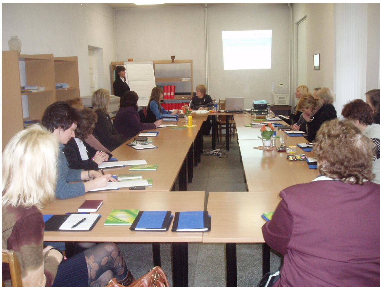
Seminaro Marijampolėje akimirka

Statistika. Vokietijoje gyvena 82 mln. gyventojų iš jų 6,7 mln. (apie 8,17 %) yra užsieniečiai atvykę iš 200 šalių. Šlėzvingo – Holšteino žemėje gyvena 2,8 mln. gyventojų iš jų 131 331 (apie 4,69 %) – užsieniečiai, spėjama, kad 500 000 žmonių yra nelegalai (t .y. neturi dokumentų, leidžiančių oficialiai gyventi Vokietijoje).