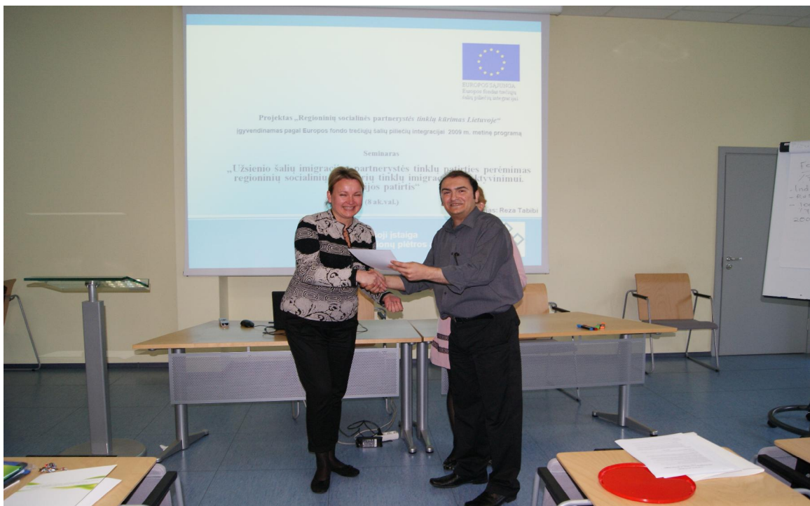
Ekspertas įteikia pažymėjimą vienai iš susitikimo dalyvių